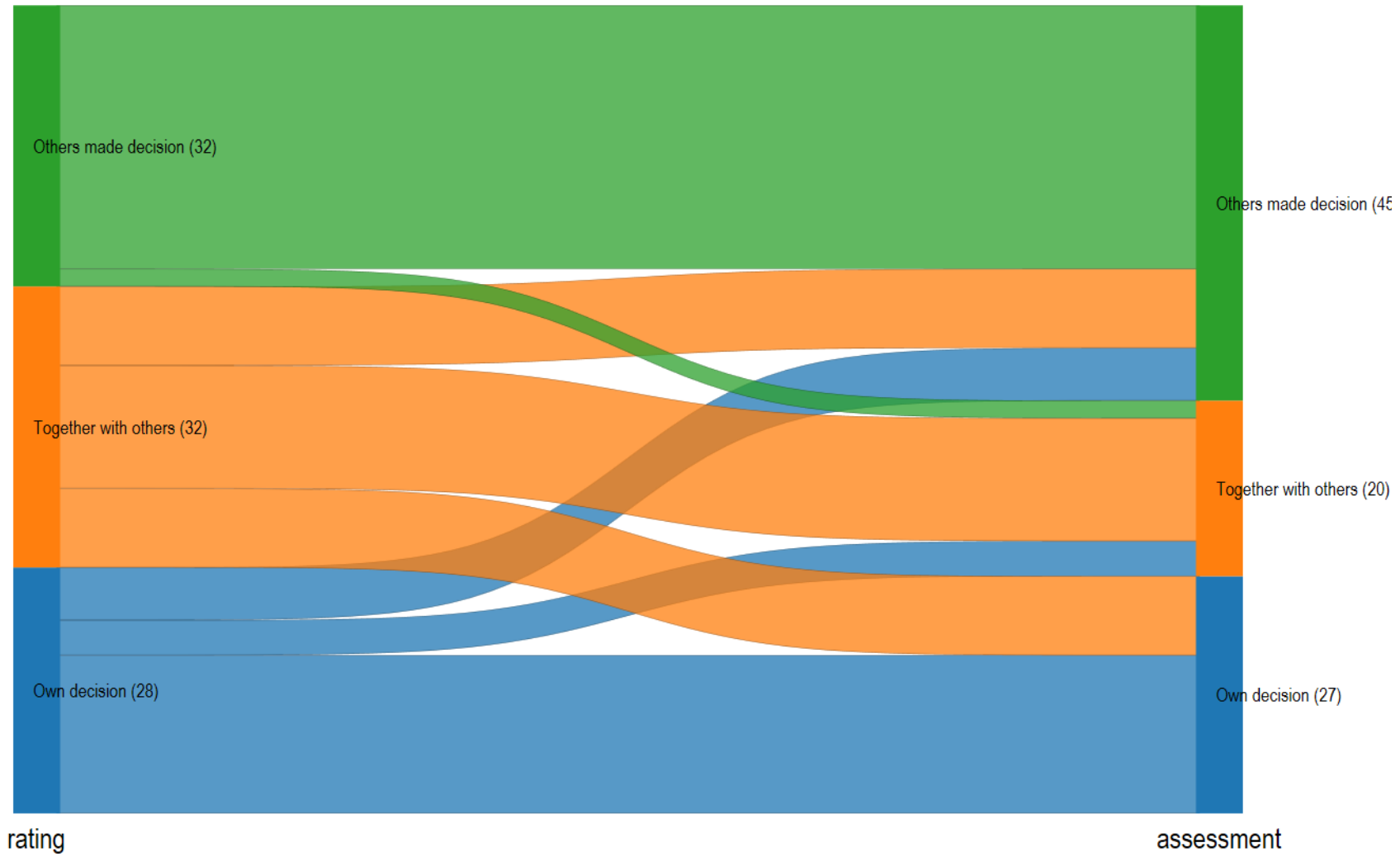
Table C2: Sankey Plot "Decision to move"