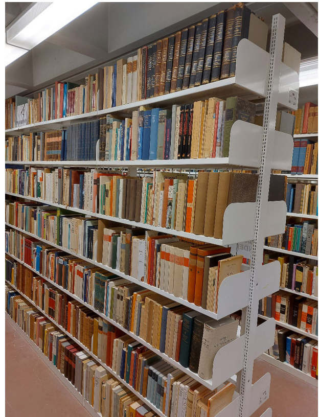
Teil der Sammlung Rabe

Die Vielfalt, der in der Sammlung Rabe behandelten Themen fand ich sehr spannend, da sich unter den Büchern die unterschiedlichsten Monografien oder mehrbändige Werke zu den verschiedensten Themengebieten fanden (z. B. Geschichte, Allgemeinbildung, Länder & Reisen, Politikwissenschaft, etc.).