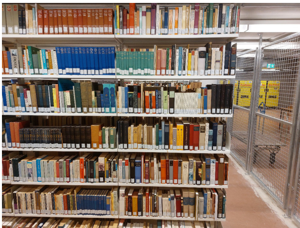
Beginn der Sammlung Iser

tur: ita 959:e205:k/c45a; dieses Buch spiegelt die Zerrissenheit des Protagonisten Simonini im Zwiespalt mit den im 19. Jahrhundert geltenden Konventionen besonders anschaulich wieder; oder die Anthologie „Ein Sizilianer von festen Prinzipien“, von Leonardo Sciascia, die unter anderem die Erzählung „Tod des Inquisitors“ enthält. In dieser Erzählung (Signatur des enthaltenen Werkes: ita 959:s416:f/u21) wird anschaulich und mit Bezug auf die vorhandenen historischen Quellen, die Geschichte des Augustiners Diego La Matina dargebracht. La Matina stellte für Sciascia ob seiner Lebensumstände und Geschichte ein literarisches Vorbild dar.