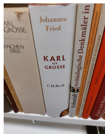
Fried: Biografie Karl der Große