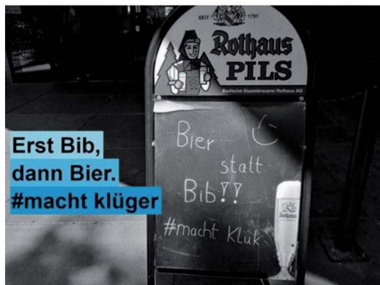
Ein Facebook-Post während des Public-Viewings der Fußball-WM im Uni-Biergarten.