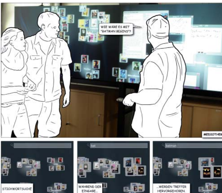
Abbildung 2: Ein großes hochauflösendes Display ermöglicht eine Diskussion mit mehreren Personen. Über ein Texteingabefeld können relevante Medienobjekte hervorgehoben werden

MedioVis 2.0 ermöglicht eine direkte Integration der Suchfunktionalität in die Informationslandschaft. Dabei werden keine Listen oder Fenster für die Darstellung von Suchtreffern verwendet. Das Eingabefeld in der oberen rechten Ecke des Bildschirms dient in MedioVis 2.0 als Ausgangspunkt einer analytischen Suche. Jeder Tastendruck löst eine Skalierung der korrespondierenden Medienobjekte auf der Informationslandschaft aus. Dabei wird der Suchbegriff mit bestimmten Metadaten (Titel, Jahr, Personen, Fachgebiet etc.) der Objekte verglichen.