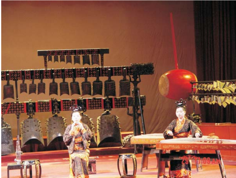
Museum der Provinz Hubei

sog. „Dishes (Schüsseln)“, die dann nach und nach gebracht werden. Jeder Teilnehmer bedient sich mit seinen Stäbchen aus den Schüsseln. Bei offiziellen Essen legt der Gastgeber den Gästen die besten Stücke auf den Teller, wobei es durchaus Unterschiede gibt, was die Gäste und was die Gastgeber für die „besten“ Stücke halten. Mitunter hilft da nur: „Augen zu und runter damit“. Nach und nach, ohne dass eine bestimmte Reihenfolge einzuhalten ist, bedient man sich aus allen Schüsseln. Es ist nicht höflich, Schüsseln leer zu essen, und es ist problemlos, Schüsseln zurückgehen zu lassen, aus denen kaum etwas entnommen wurde. Bei der Auswahl der Gerichte anhand der Speisekarten sollte man als Europäer einerseits mutig sein und andererseits etwas Englischkenntnisse haben, denn gekochte Hühner-, Gänse- und Entenfüße sind genauso wenig jedermanns Geschmack, wie wir bei „Squirrel“ Beißhemmungen hatten, es handelt sich um Eichhörnchen. Reis gibt es übrigens nur auf besondere Nachfrage. Es lohnt sich immer, einen Blick in die Küchen zu werfen, wo ganze Hundertschaften von Köchen die Woks bedienen – es gibt garantiert nichts, was im Wasserbad warm gehalten wurde oder gar vom Tiefkühlschrank in die Mikrowelle gestellt wurde. Zu empfehlen sind Lokale, in denen nur oder hauptsächlich Chinesen essen