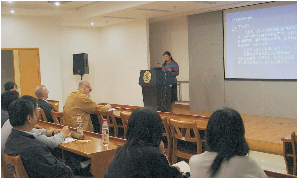
Vortrag in Wuhan

später in Gesprächen bestätigte: Es war kein Kurs zu einem bestimmten Teilaspekt von Informationskompetenz, wie wir das bei uns praktizieren, also beispielsweise zum Thema: „Wie bewerte ich die Ergebnisse einer Recherche im Internet“. Vielmehr ging es um einen Vortrag über die Frage, was Informationskompetenz bedeutet, wer das „erfunden“ hat, untermauert mit Belegen aus der angloamerikanischen Literatur (das war das einzige, was wir den Folien entnehmen konnten). Die anschließende Diskussion wurde uns teilweise übersetzt, wobei die Teilnehmer, soweit es Mitglieder der Akademie waren, also Wissenschaftler und keine Bibliothekare, ganz handfeste Fragen und Wünsche hatten, die auch wir kennen, z.B. „Warum bezahlt die Bibliothek nicht die sog. Page fees (etwa zu Übersetzen mit „Druckentgelte“) für die Wissenschaftler, die fällig werden, wenn in einer Fachzeitschrift publiziert werden soll.